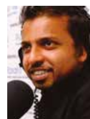
RAJU – RÉSONANCE LE HAVRE