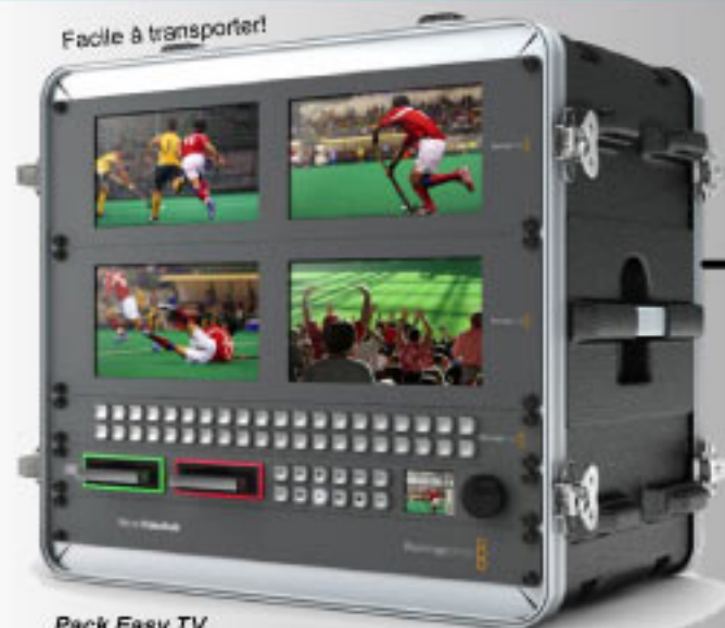
Pack Easy TV