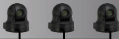
3 caméras robotisées Sony full HD

Parce que l'image fait désormais partie intégrante de votre communication, le Pack Easy TV vous permet facilement de créer du contenu vidéo à forte valeur ajoutée.