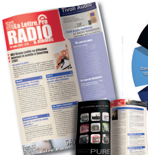
CIRCULATION DE LA LETTRE PAR ZONE

La Lettre Pro de la Radio et des Médias s'adresse aux décideurs , aux Présidents Directeurs Généraux, aux Directeurs Généraux, aux Présidents, aux dirigeants ou responsables en lien avec le média radio et ses périphériques, aux institutions, aux opérateurs de diffusion, aux écoles de journalisme, aux fabricants ou distributeurs de matériel ainsi qu'à l'ensemble des acteurs de la radio. Elle s'adresse également aux annonceurs et acteurs de la publicité dans les médias.